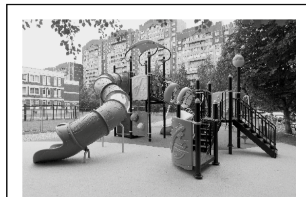
ИТОГИ СЕЗОНА БЛАГОУСТРОЙСТВА