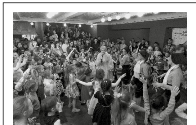
НОВЫЙ ГОД С ШИРОКИМ РАЗМАХОМ

Сегодня наш долг – сделать все, чтобы люди, пережившие страшные блокадные годы, всегда были окружены нашей заботой и вниманием. Мы низко кланяемся вам, дорогие ветераны и блокадники, за то, что вы подарили нам возможность мирно жить и трудиться в сильной, свободной, независимой стране. Желаем Вам крепкого здоровья, благополучия, оптимизма, тепла и заботы близких!