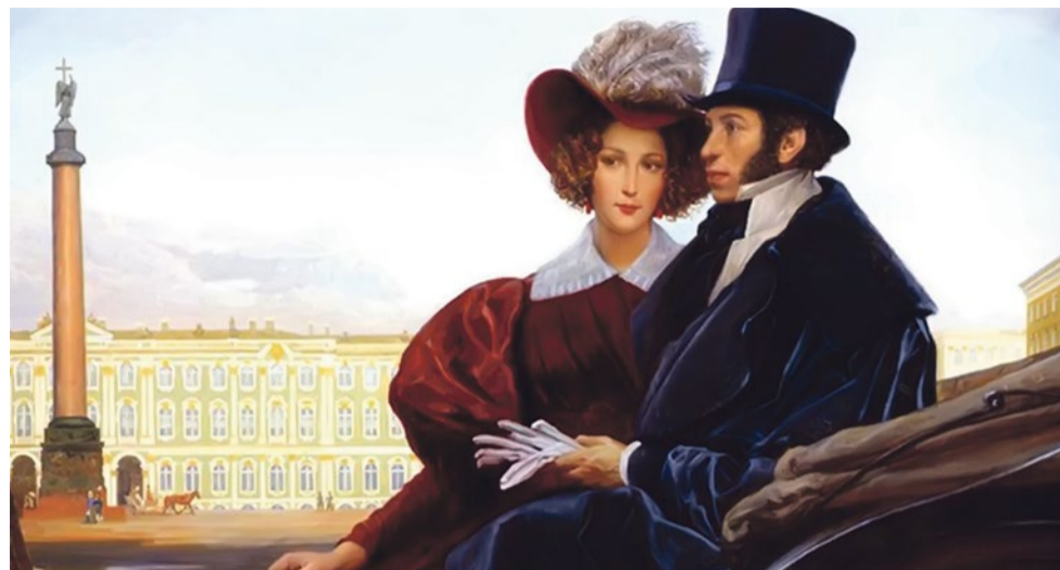
Дворцовая площадь. М. Ю. Шаньков

Судьба вновь приведет поэта на Черную речку, где так недолго он был счастлив в кругу семьи и друзей. Место для дуэли между Александром Сергеевичем Пушкиным и поручиком кавалергардского полка Жоржем Шарлем Дантесом было выбрано не случайно: этот глухой безлюдный уголок у Комендантской дачи даже прослыл «дуэльным», поскольку его впоследствии не единожды выбирали для поединков. Во всем мире знают место роковой дуэли на берегу Черной речки, где 27 января 1837 года в 16 часов 30 минут выстрелом Дантеса был смертельно ранен великий русский поэт Александр Сергеевич Пушкин. В 1937 году здесь появился памятник, созданный по проекту архитектора