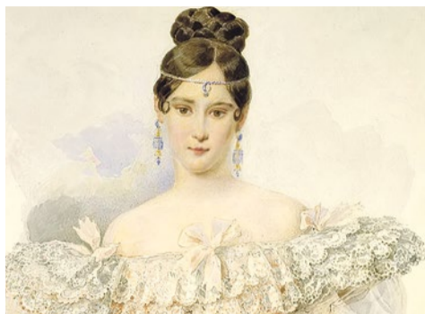
Портрет Н. Н. Пушкиной. А. П. Брюллов