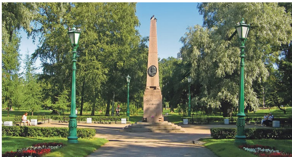
Обелиск на месте дуэли А. С. Пушкина на Черной речке