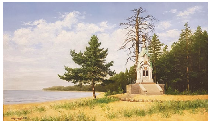
И. Е. Никифоров, «Лахтинское взморье у Экскурсионной станции с часовней», 1907 г.