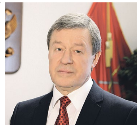
Дорогие жители нашего округа!

Д ень народного единства – это торжество нашего государства, отечественной истории, мира и согласия. Это важная дата для всех, кому дороги идеалы гражданственности и патриотизма.